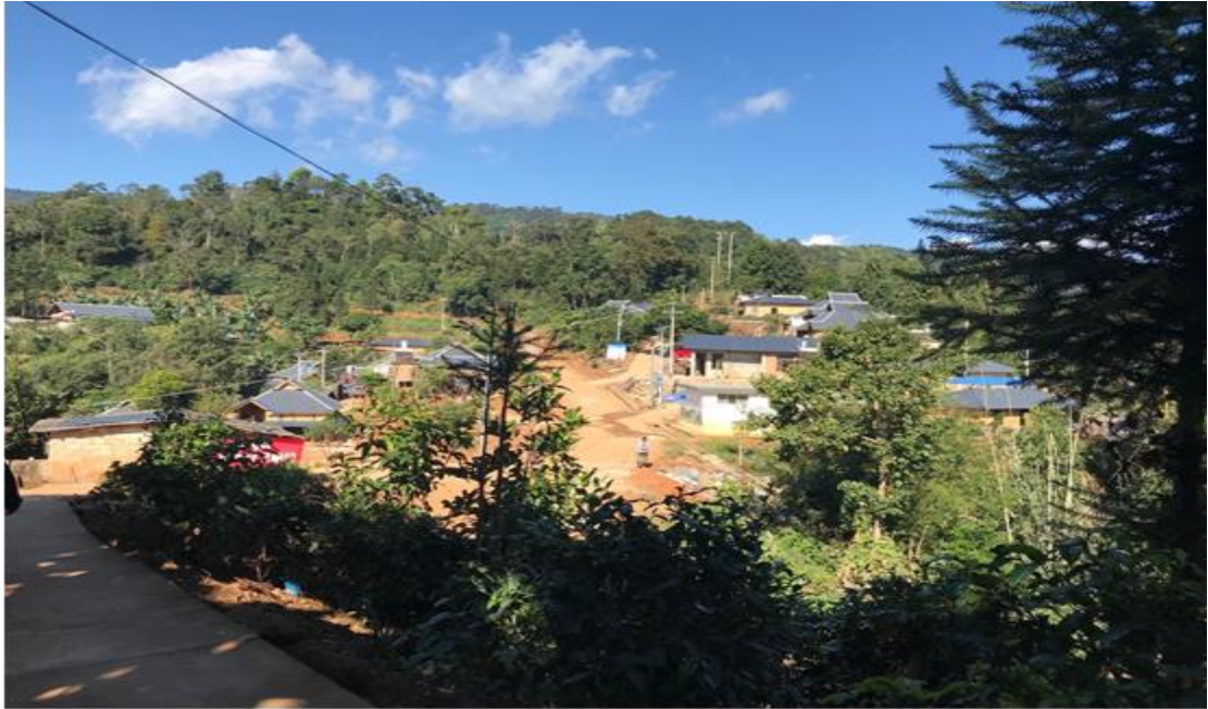
图 6. 2019 年 12 月案例小组调研过程中拍摄的曼先坦中寨 (因为季节不对, 道路两旁的格桑花没有盛开)