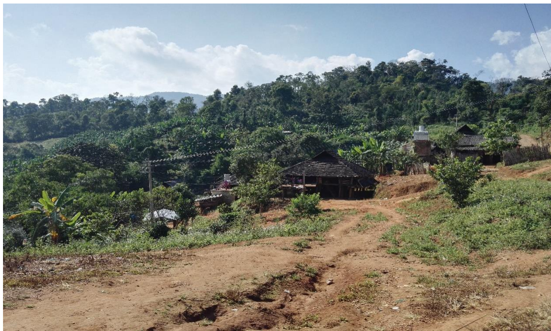
图 2. 刚开始“挂包帮”时候的曼先坦中寨（2015 年）