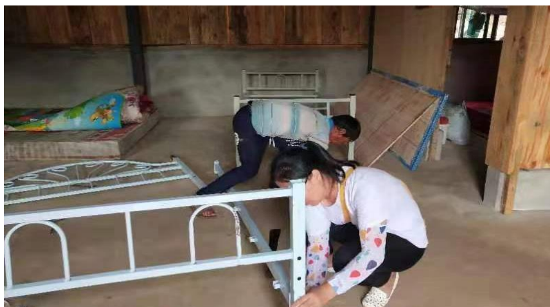
图 5. 一起动手，感受现代文明生活

正因为预先料到贫困户对于一些现代家具的使用和装配很陌生，帮扶单位通过亲身示范和一遍遍地演示，使得曼先坦中寨和高寨的家具利用率远高于其他帮扶村寨，没有发生物资闲置不用或者浪费丢弃的情况。