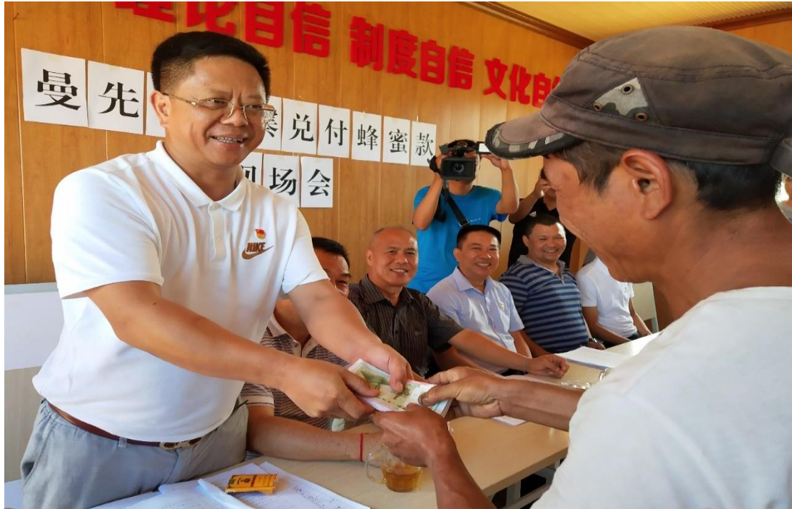
图 4. 兑现蜂蜜款，贫困村民喜获丰收

这一次“敲锣打鼓”兑现蜂蜜款的事情，对于村民们的刺激还是蛮大的。已经养蜂的人家决心好好干，扩大规模干，明年争取更多的收益；没有养蜂的人家觉得他家可以干，我家也行呀，也许我家干得还更好。于是，养蜂的积极性上来了。这一做法符合助推中的“触发机制（Incentives）”，和“社会规范（Norms）”。人是群体性的生物，因此周围人群的行为选择会对个体产生影响。政府可以利用人们的从众心态来实现助推。比如美国的电力公司 Opower 在给用户寄《用电情况表》的时候，会同时附上这个家庭的用电情况和同一地区其他家庭同期的用电情况的比较。这一简单的做法居然使得这些用户的能源消费下降了 2%，效果等同于提价 11%—20% 7 。