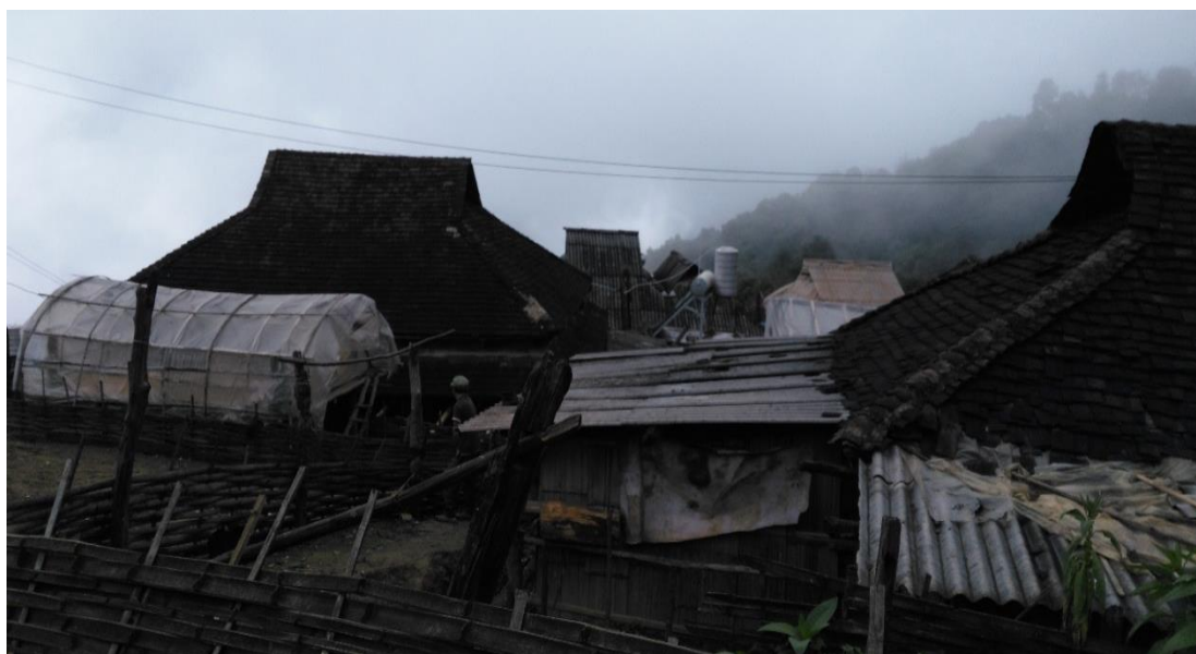
图 3. 刚开始“挂包帮”时候的曼先坦高寨（2015 年）