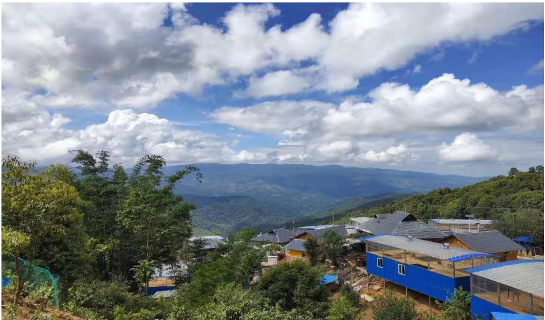
图 7. 2019 年 12 月的曼先坦高寨: 云蒸霞蔚, 屋舍明亮宽敞, 美不胜收

村头有美景, 户边有果树, 呈现村庄环境美; 山上原始森林和古茶树, 山下橡胶林, 山上山下林相连, 呈现休闲农业美; 水泥道路串户通, 绿树随路行, 呈现道路畅通美; 户户有增收项目, 人人忙脱贫致富, 呈现经济发展美; 邻里和睦互帮助, 移风易俗新风尚, 呈现乡风乡俗美。53 户建档立卡户中, 2018 年底有